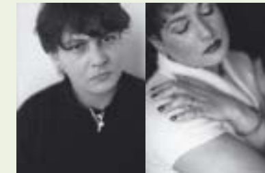
Zusammen mit dem Hamburger Drogenhilfeprojekt Subway e.V. entstand die Ausstellung »InTouch – (k)eine Zeit für Eitelkeit« mit jeweils zwei Porträts Drogenabhängiger: in ihrem normalen Outfit und auf einem späteren Foto nach Gesprächen und mit Hilfsmitteln wie Make-up und Styling, das die Wünsche, Sehnsüchte und Vorstellungen der Klienten sichtbar werden lässt.

Herausgegeben von der Superintendentur des Evangelischen Kirchenkreises Berlin-Schöneberg · Fotos: Joseph Amooti Kiiza (1); Ökumenischer Kirchentag/Scholz & Friends (3); Michael Roth (2) Konzept & Produktion: diálogo Büro für Kommunikation und Medien www.dialogo.de · Auflage: 15000